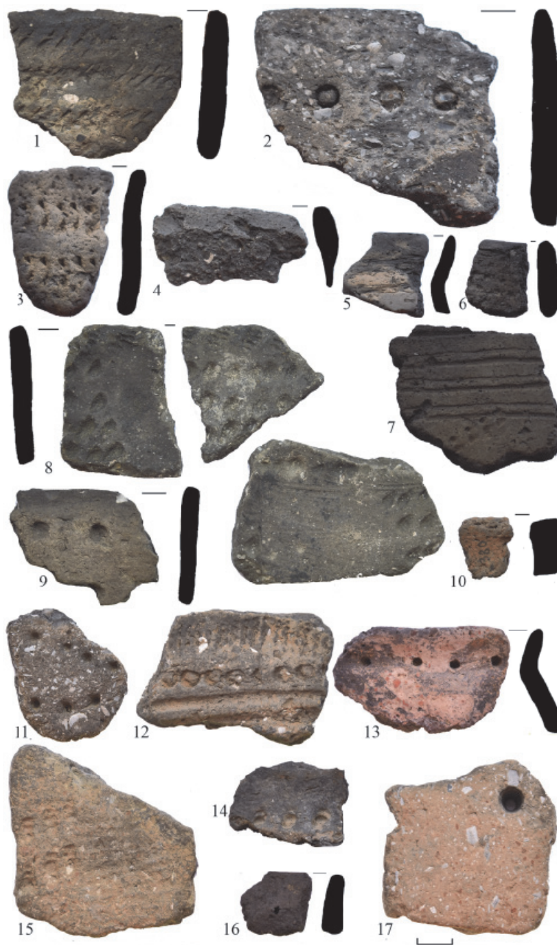
Рис. 5. Керамические материалы с поселения Пункт 380: 1-7 – нижнедонская культура, 8-10 – среднестоговская культура, 11-17 – репинская культура

пов и обломков кремня случайных форм. Присутствие на памятнике изделий геометрических форм традиционно имеет очень глубокие корни, но в то же время отсутствуют какие-либо отчетливые признаки, позволяющие бесспорно связать их с какой-либо из известных этнокультурных областей. Возможно, часть этой каменной и костяной коллекции относится к эпохе мезолита.