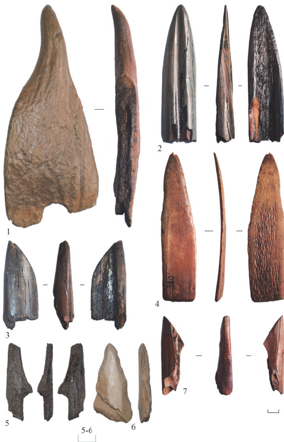
Рис. 2. Поселение Пункт 380 на Верхнем Дону: 1-7 – изделия из кости и рога

1. Среднедонская культура эпохи раннего неолита. Керамика данной культуры представлена 14 фрагментами (рис. 3: 1-12). По определению А.А. Куличкова посуда толщиной 5-7 мм, изготовлена из илистой глины. Искусственной примесью является шамот в концентрации 1:5, 1:7. Ее цвет варьируется от серого – к коричневому. Один из сосудов