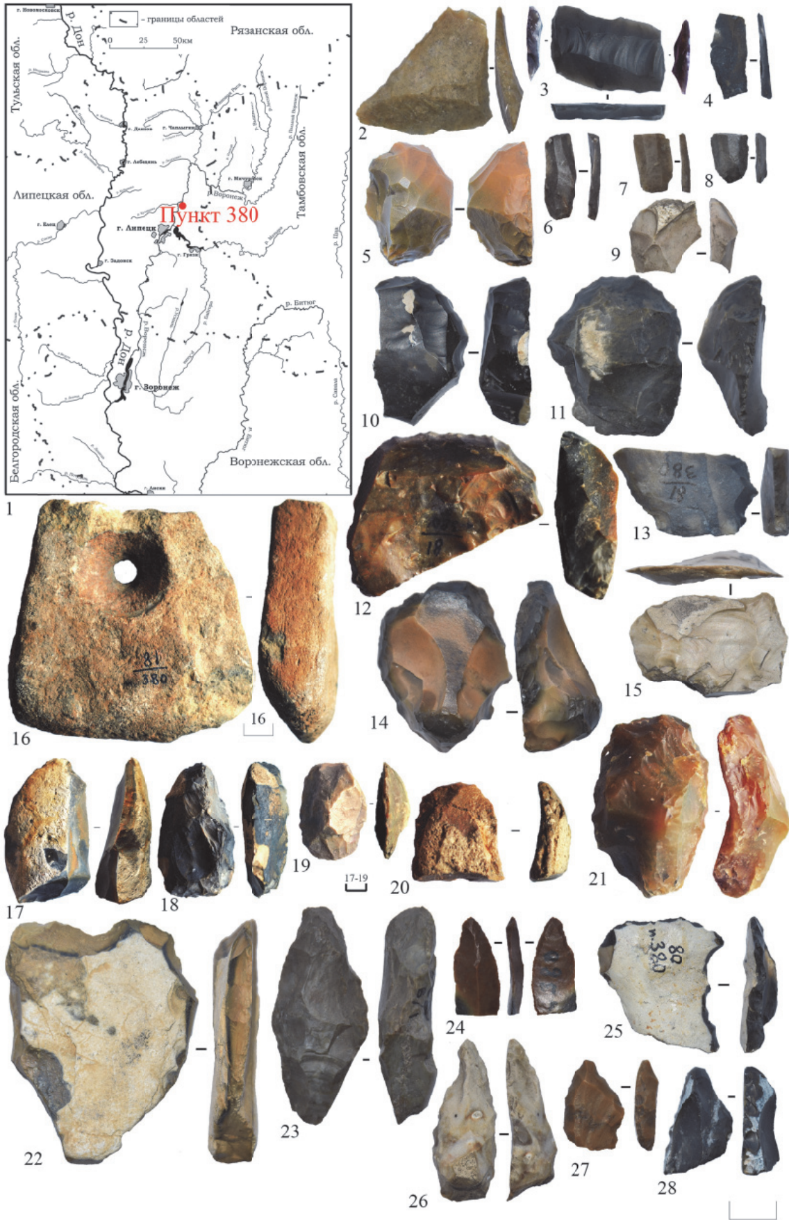
Рис. 1. Поселение Пункт 380 на Верхнем Дону: 1 – местоположение памятника на карте Центрального Черноземья; 2-28 – каменный инвентарь