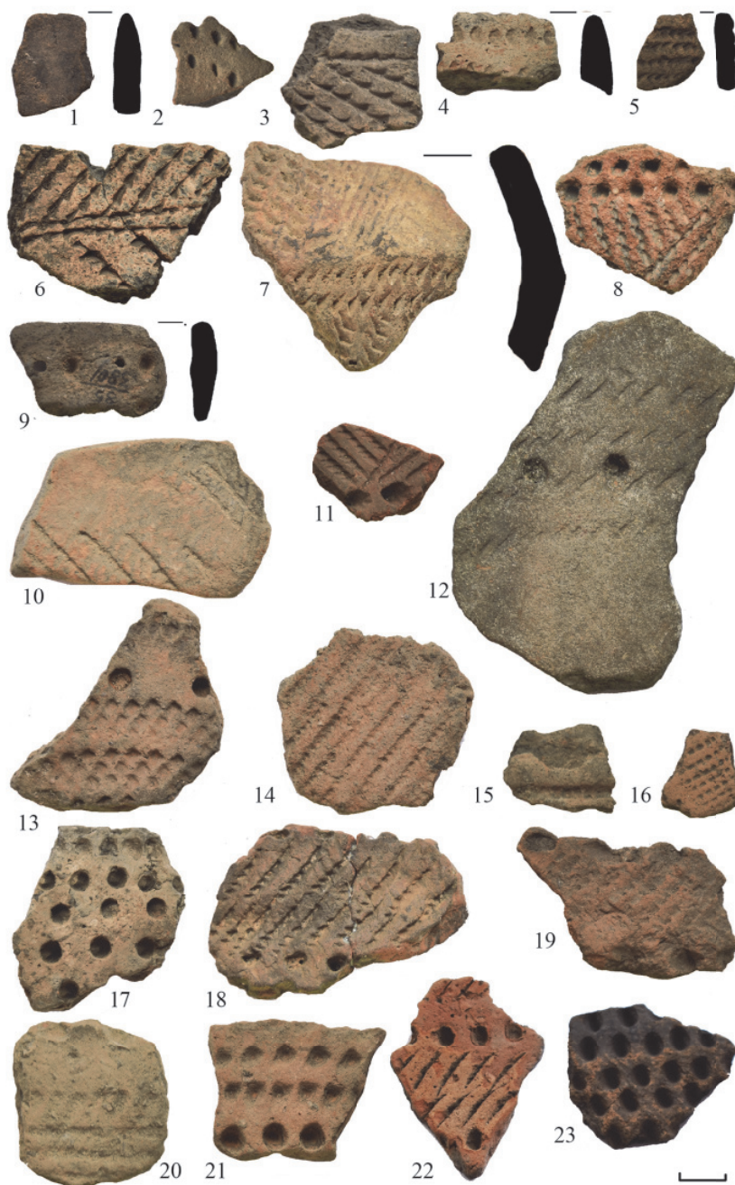
Рис. 3. Керамические материалы с поселения Пункт 380: 1-12 – среднедонская культура; 13-21 – архаичный этап льяловской культуры; 22-23 – поздний этап льяловской культуры

(рис. 5: 8-10). Верх двух венчиков округлый (рис. 5: 8-9), а один – плоский (рис. 5: 10). В тесте встречается толченая ракушка. Керамика толщиной 5-6 мм. Цвет теста преимущественно серый. Ямочные вдавления подразделяются на круглые и конические. Выявлен один фрагмент керамики с круглыми ямками, а три – с коническими. Диаметр круглых ямочных вдавлений составляет не более 5-6 мм. Распространен мотив